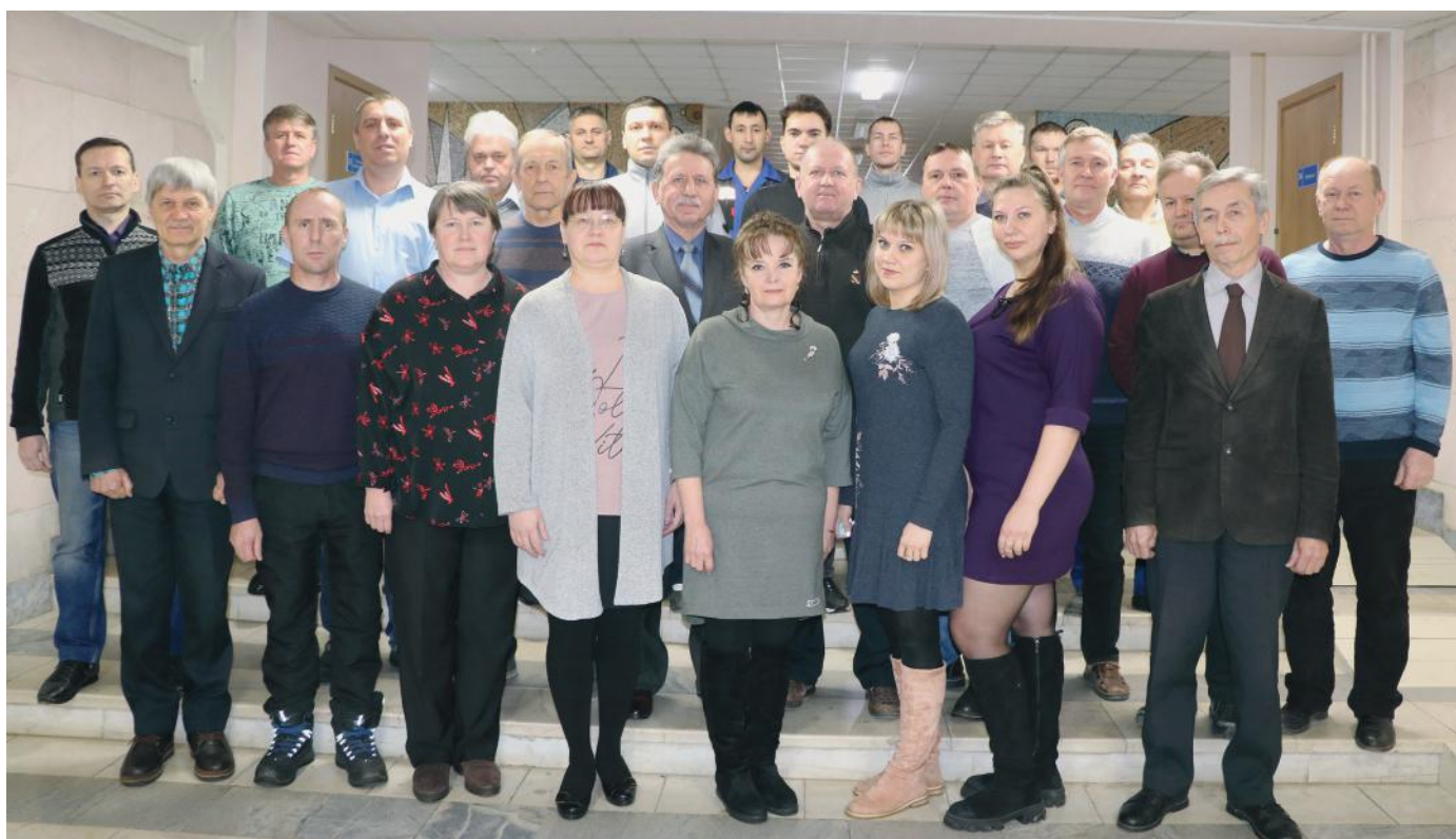
Коллектив отдела автоматизации, январь 2022 года